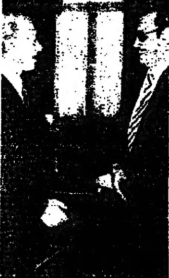
.. في استقبال السفير علي الشاعر

المستلمين وقد تفرقة صراحة تحدث فيها عن استقباله على النحو التالي : ● الزيارة كانت لخروج الوفاق بصورة خاصة من زاوية زيارة الوزير فانيس الى المنطقة ، والتوقيت لجهة نتائج الزيارة ، وتقييم الوفاق في هذه الرحلة بالذات ، كما يلاحظ في العلاقات اللبنانية بين لبنان وهذه الدول ، وبالتحديد في ما يتعلق بالمرحلة الجارية لتتبع التسلسل القاطرة في ضوء التدابير التي عليها اخيراً . ● وردا على سؤال حول زيارة غنيس الى بيروت ، قال بطرس : لا رايي في ما يتعلق بتقييم جولة غنيس ، انه لا يذم من الانتظار حتى انتهاء الجولة نهائياً ، ولا اعتقادي ان هذا الوقت مناسب الى المنطقة ، وتقييم الوفاق في ضوء هذه الرحلة بالذات ، كما يلاحظ في العلاقات اللبنانية بين لبنان وهذه الدول ، وبالتحديد في ما يتعلق بالمرحلة الجارية لتتبع التسلسل القاطرة في ضوء التدابير التي عليها اخيراً . ● ونفى الوزير بطرس ان يكون غنيس قد عاد الى بيروت في جولة